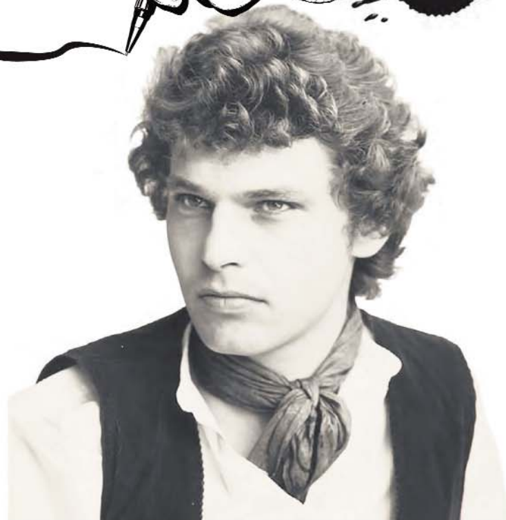
Portret van de schrijver