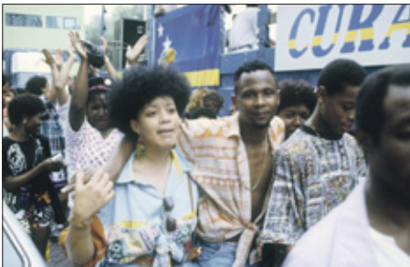
Ook in Nederland zijn er Curaçaoënaars op het goede en slechte pad.

FOTO PETER MARTENS/COLLECTIE NEDERLANDS FOTOMUSEUM (1987)