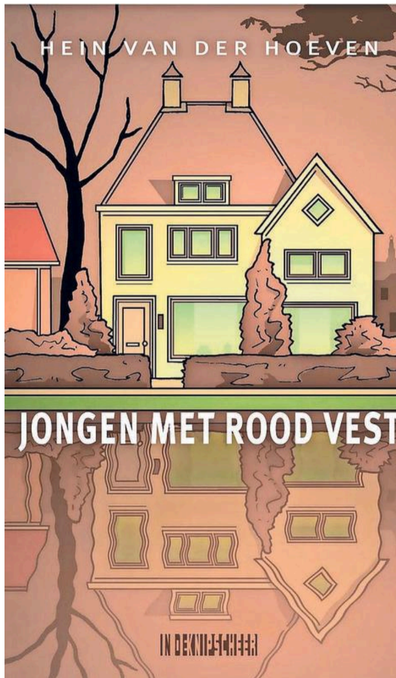
Boekomslag 'Jongen met rood vest'

De roman bevat geen autobiografische elementen, behalve dan de plaats waar de schrijver geboren is. Haarlem komt er uitgebreid in