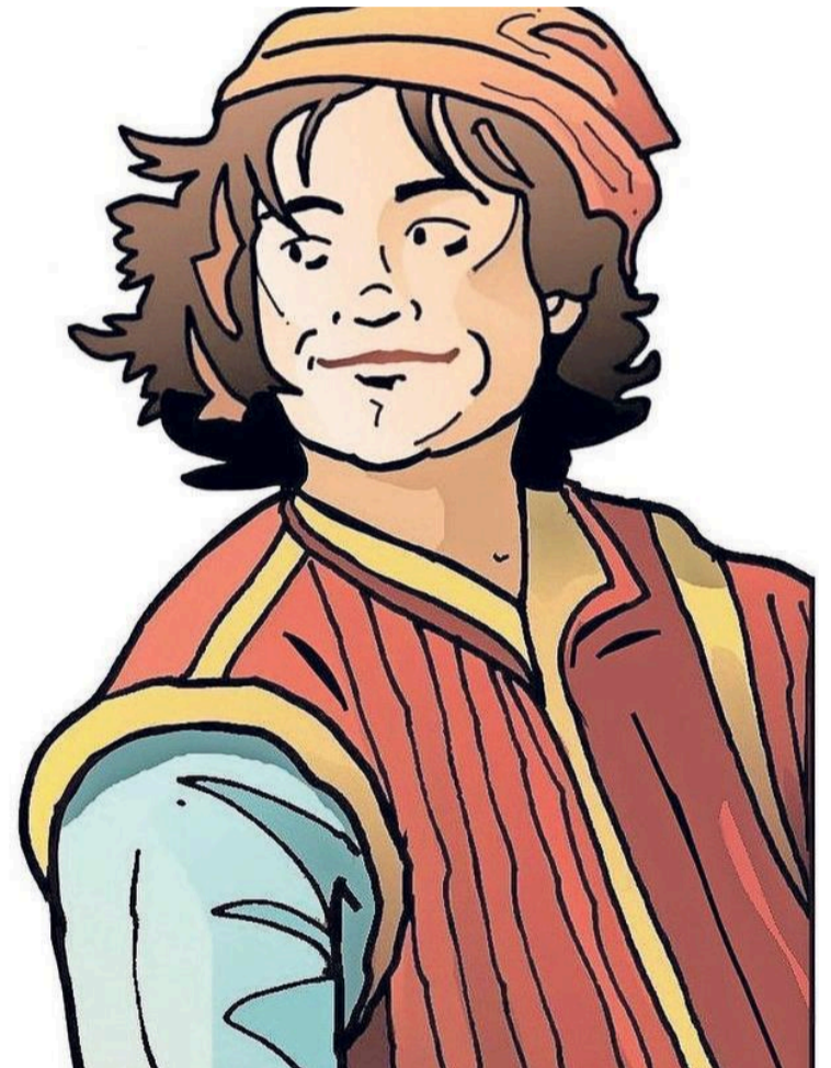
Het schilderij in kwestie

naar de Meindert Hobbemastraat in Heemstede. Mijn grootouders woonden in de Zonnelaan. Daar gingen we vaak op bezoek. Die plekken ken ik goed. Al schrijvend