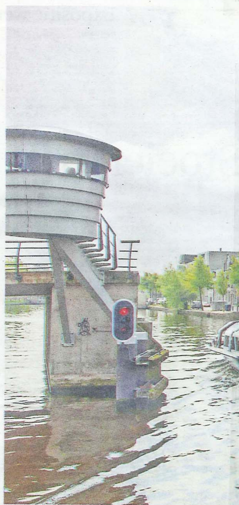
Een rondvaartboot vaart onder de Langebrug door, de schildering onder de br