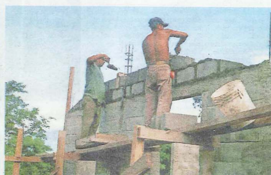
Werken aan woningen in Hobhouse, dankzij Haarlemse steun.