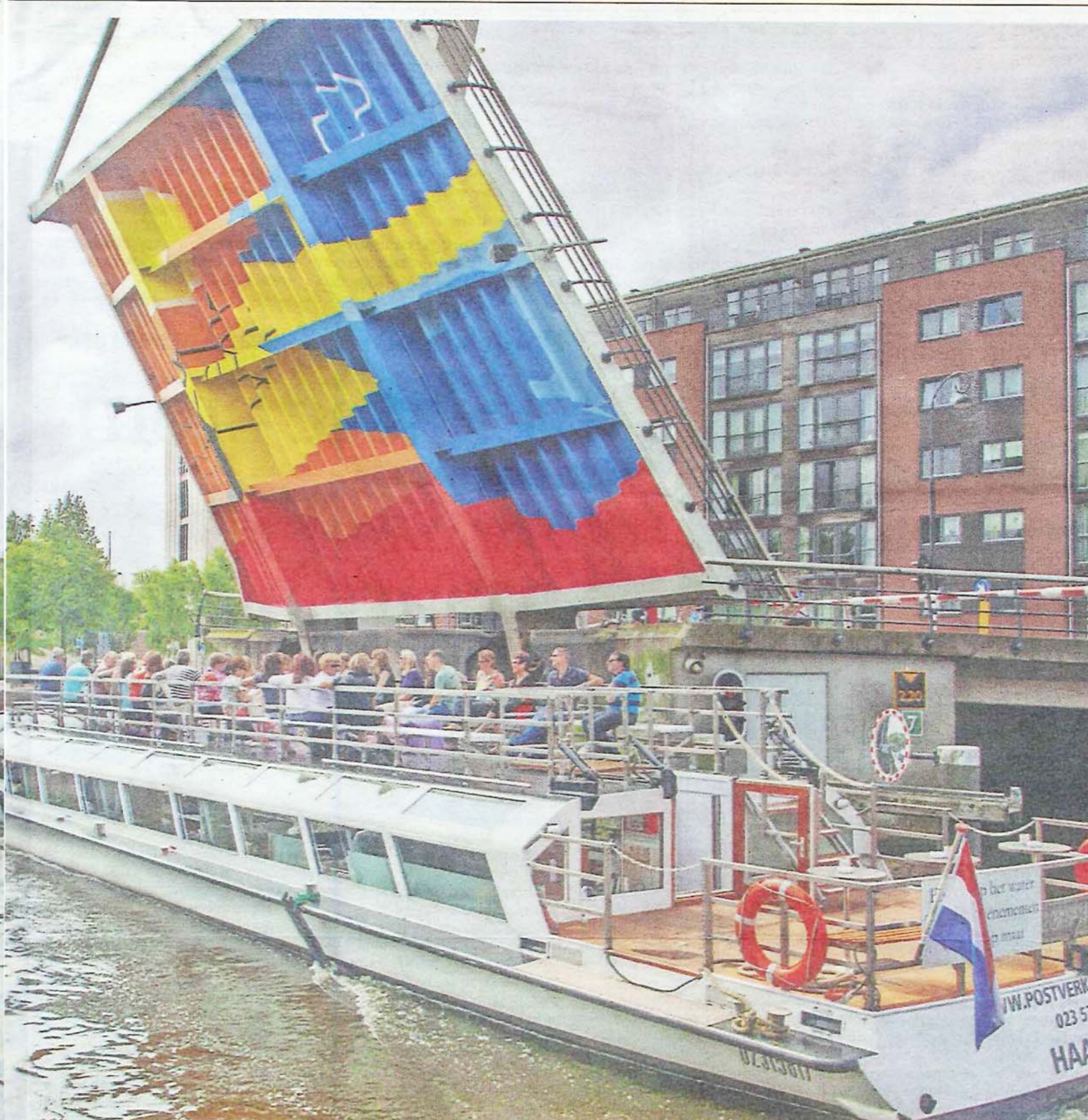
is van kunstenaars uit Zimbabwe.