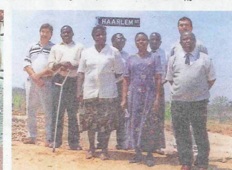
Het straatnaambordje Haarlem St, plek voor ‘Haarlemse’ huizen in Mutare.