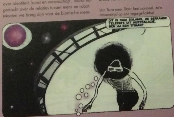
Van Terra naar Titan: heel normaal, zo'n titanenstrijd op een vega-gehekbal

over identiteit, kunst en wetenschap, wordt na gedacht over de relaties tussen mens en robot. Moeten we bang zijn voor de bionische mens