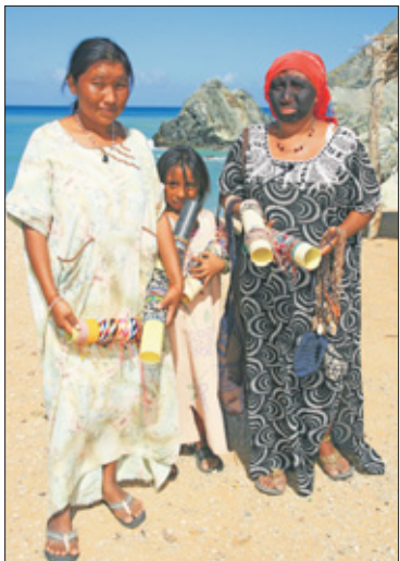
De Wayuu of Guajiro's (Arawaks: 'machtige man') zijn een inheems volk in het uiterste noorden van Colombia en Venezuela. Ze bewonen een woestijngebied van zo'n 28.000 vierkante kilometer, waar van ruim 15.000 vierkante kilometer in La Guajira, Colombia en 12.000 in Zulia, Venezuela. Bij volkstellingen van respectievelijk 2011 en 2005 werden ruim 415.000 Wayuu in Venezuela en 270.000 in Colombia geregistreerd.