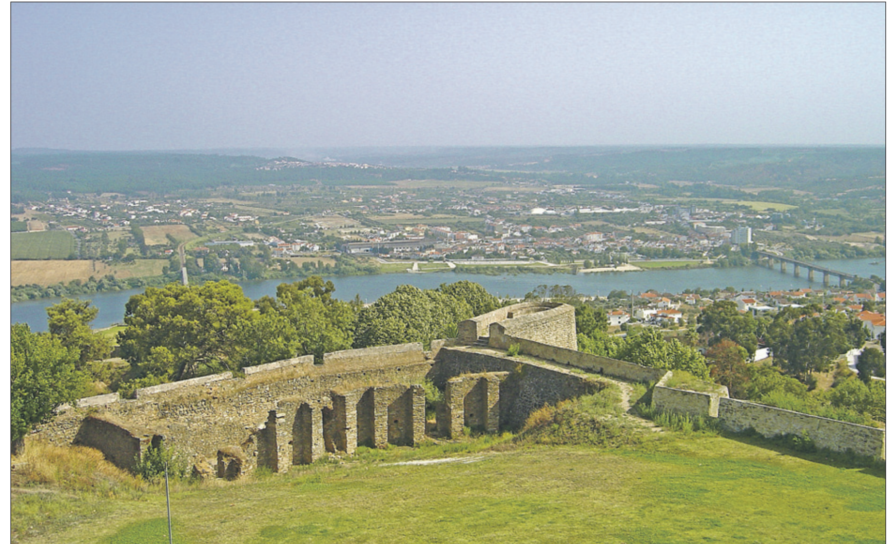
De geschiedenis van de moeder van hoofdpersoon Edgar begon in Abrantes, Portugal.