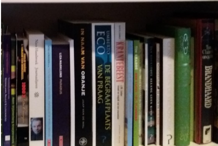
De coronacrisis zorgt bij sommige schrijvers voor nieuwe inspiratie.

„De gemeente Heerlen ziet literaire auteurs niet als een serieuze beroepsgroep. Het is, zo heb ik gehoord, meer kunstenaars overkomen.”