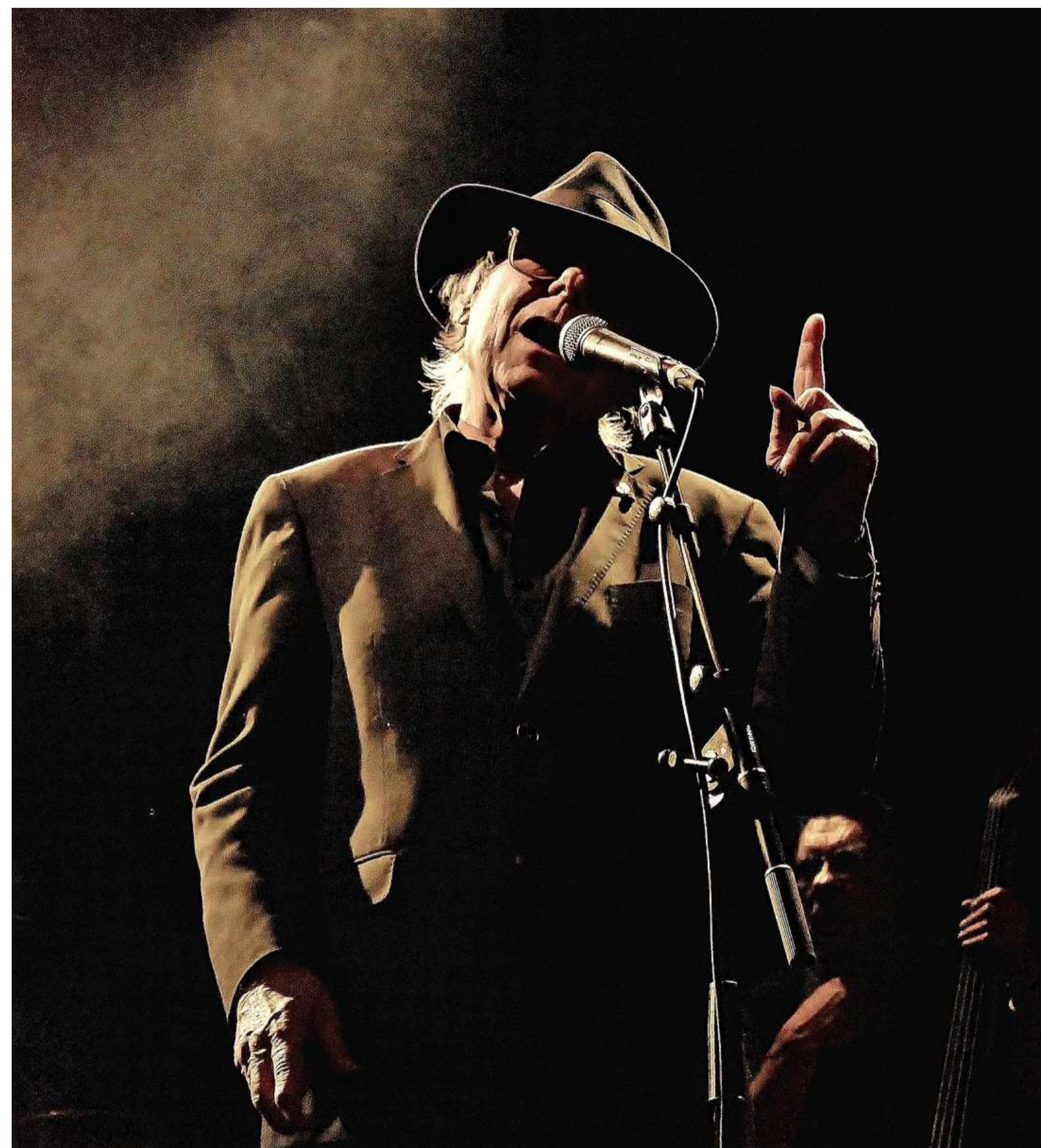
Oscar Benton in actie.

Het verhaal over een blues-artiest die beroemd wilde worden; Oscar Benton bereikte begin jaren 80 een nummer 1-positie in de Franse hitlijst.