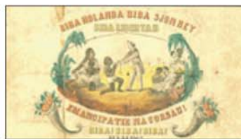
Een ansichtkaart over de emancipatie van Curaçao.

De Haas vangt zijn boek aan met een aanhaling van een verkiezingsvoordracht van de partij-