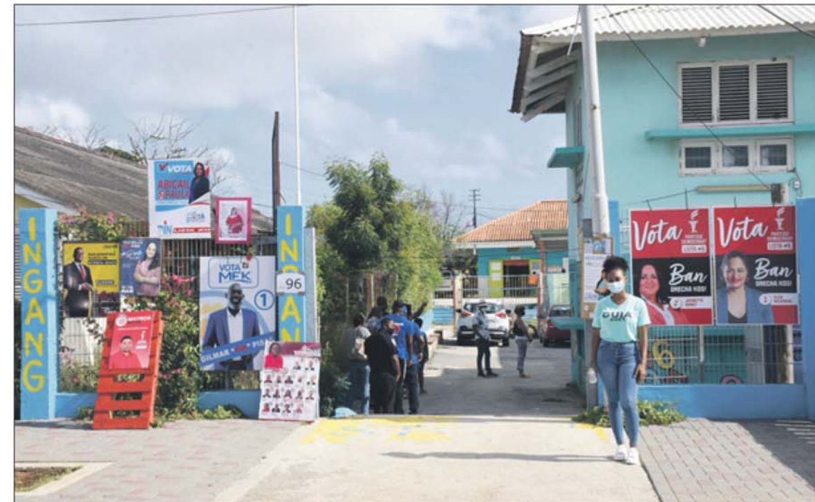
Het wantrouwen, een gevolg van de slavernij, is het duidelijkst merkbaar rond de verkiezingstijd, als de partijen die de belangen van de naar afkomst verdeelde bevolking moeten behartigen, de strijdbijl opgraven.