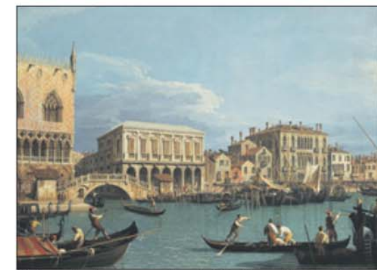
Zicht op de slavenoever Riva degli Schiavoni in Venetië.

Servus, ISBN 978-94-93214-16-3 Auteur: Fred de Haas