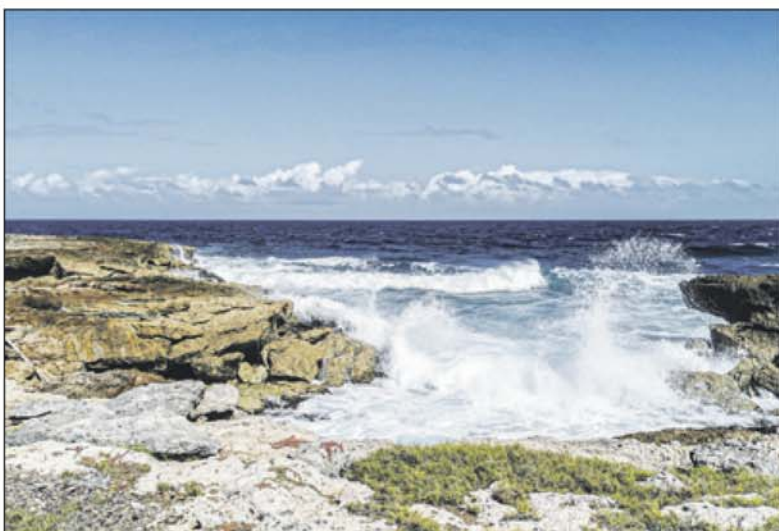
'Between you and me is a sea of difference'.