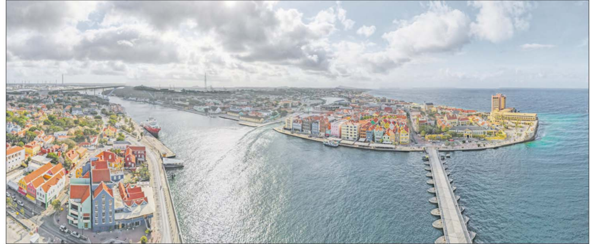
Irma Weever is een jonge Surinaams-Curaçaose vrouw. Haar ouders willen dat zij gaat stralen, gaat excelleren, zich bewijzen in het verre Nederland en daar gaat studeren.

trokken luiken waaronder ladders. Toen je om het huis heen liep, had je niet de indruk dat het al die ruimtes en verdiepingen, doorgangen en lagen, kón bevatten. Dat maakt het onwerkelijk-surrealistisch, misschien wel magisch-realistisch. Of moet ik zeggen dat het boek is als de matroesjka - de pop die je opent, waarin een kleinere pop die je opent, waarin... Een beeld dat ook in de roman zelf voorkomt. „Wat is de laatste pop?“, denkt de lezer al openend. De pop die geen andere pop meer bevat. De pop uit één stuk, de naadloze pop? Het binne-tenne, het wezen, de kern van de mens, een mens, een individu? Een ander, verwant, beeld (of motief) is dat van de schaduw. En wel een schaduw van een schaduw. Een schim of projectie... Wát is essentie of entiteit, en wat haar schaduw. Valt dat uit te maken, valt dat definitief uit te maken? Wat is iemands ware identiteit? Kun je iemand werkelijk kennen en doorgronden, kun je iemand werkelijk geloven en vertrouwen? Irma Weever is een jonge