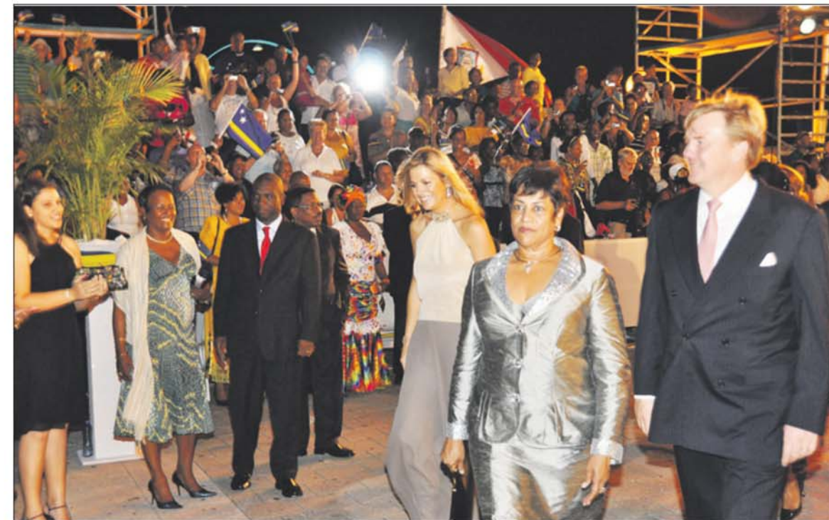
Ook 10-10-'10 komt in het boek voor.

De verwachte verwoestende orkaan van september 2017 is voor de uitvoering van die theorie bij uitstek geschikt: „Ik kan niet wachten om het laatste appeltje met Daniël te schillen.” Paul heeft als biochemicus plannen die oneindig veel omvattend zijn en ongetroefd doen wat je zou willen doen. In een situatie van chaos is alles mogelijk: „Je kunt mensen uitschakelen. Je kunt zelfs een hele groep uitschakelen. Het kan ook beperkt blijven tot één persoon. Precies zoals jijzelf dat wil. Je bent de heerser over het leven en de dood.” Paul is op Sint Maarten om zijn uitvinding te testen: „How the mighty have fallen, mightily.” Daniël zal als proefkonijn dienen.