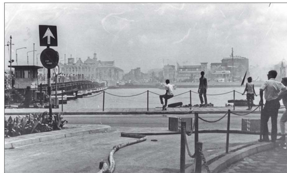
De verteller verwerkt historische gegevens, zoals de opstand van 30 mei 1969 waarbij Otrobanda in brand stond.