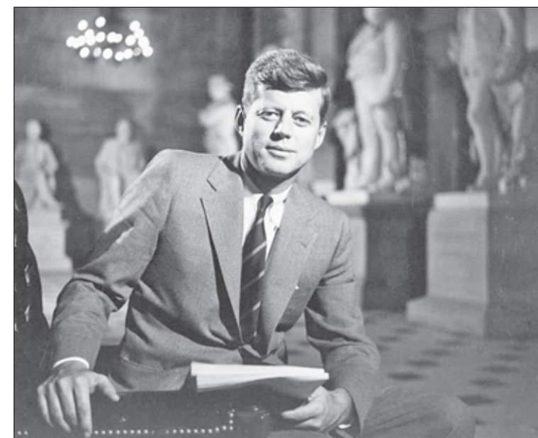
Historische gebeurtenissen worden beschreven om ook aan te geven in welke tijd het verhaal zich afspeelt. Zo ook de moord op John F. Kennedy.