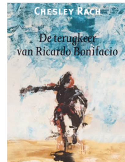
Chesley Rach schreef eerder twee anderen romans. Zijn werk kent inhoudelijk een grote variatie.