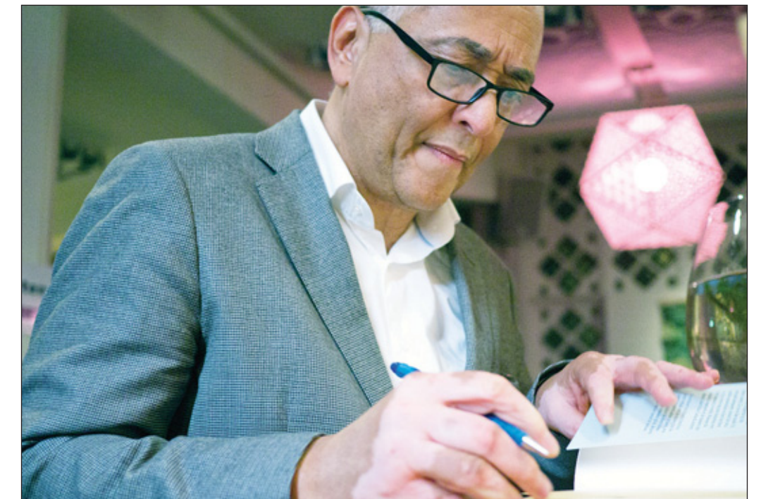
Een signeursessie met Rach.