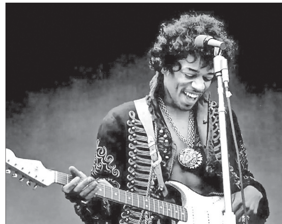
Jimi Hendrix komt ook in het boek voor.

Een familiegeschiedenis als metafoor voor de geschiedenis van een eiland