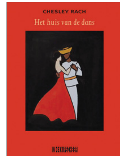
De omslag van het hier besproken boek.