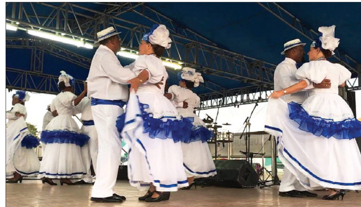
Vooral de wals 'Aura' is populair en duikt op tal van cruciale plaatsen in het verhaal op.

schillende 'beatbands' als padenstoelen uit de grond, allemaal met exotische namen als The Three Voices, The Vampires, The Crusaders, Los Honda en Los Dangers." (179) Een duidelijk voorbeeld van dit contextuele samengaan zijn de jaren zestig, waar de familiegeschiedenis en de geschiedenis van het eiland met elkaar verbonden worden omdat daar een persoonlijke crisis in het huwelijk tussen de twee hoofdpersonen zo sterk samengaat met de crisis van Dertig mei 1969, dat de gedachte opduikt dat het verhaal zelf een familiegeschiedenis is als metafoor voor de geschiedenis van het eiland, met verwarring en vernieuwing. Bij uitbreiding kan de tegenstelling tussen het hu-