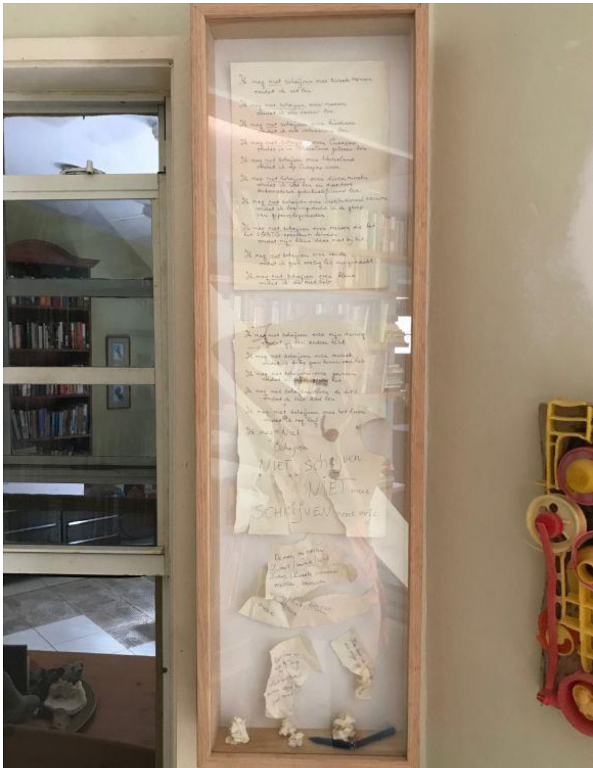
Bijdrage voor de expositie Taboo III (augustus 2022) van Landhuis Bloemhof