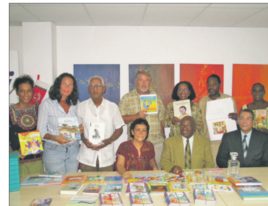
Fundashon Planifikashon di Idioma (FPI), nieuwe boeken, december 2016.