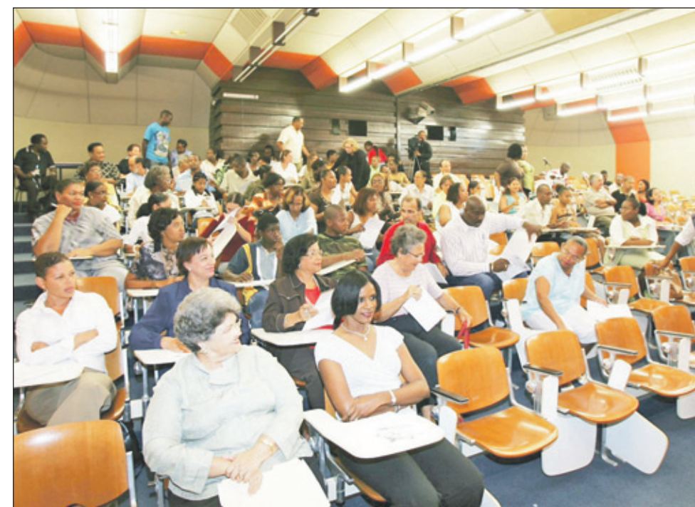
Papiaments dictee op de UoC (Diktado Papiamentu) in 2007, georganiseerd door FPI.