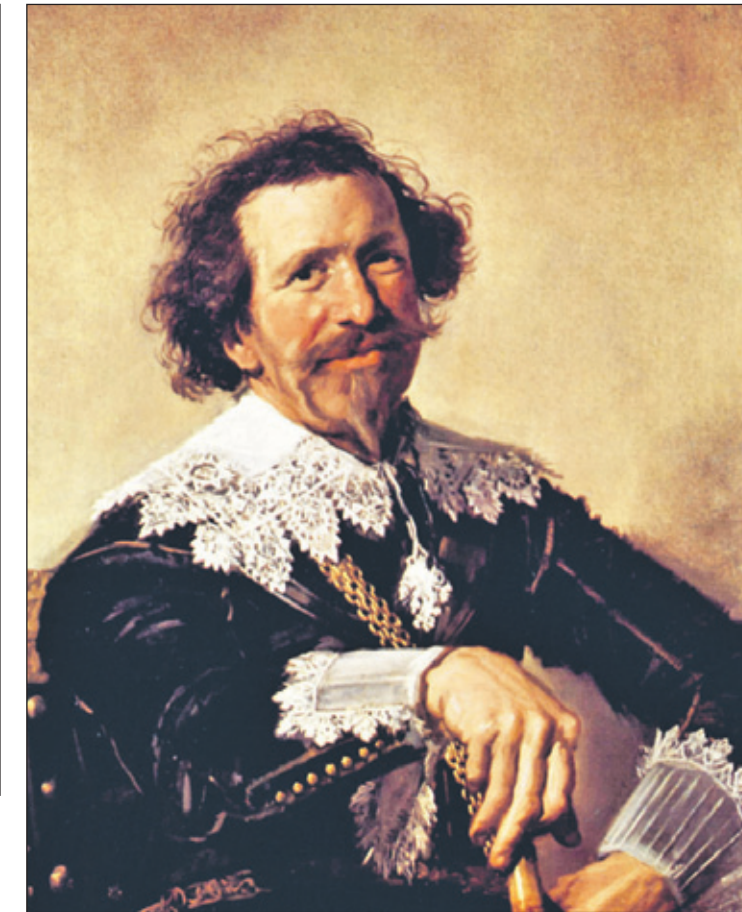
Pieter vanden Broecke geschilderd door zijn Haarlemse vriend Frans Hals 1634. Vanden Broecke was slavenhandelaar van 1606 en 1617. Hij kocht zelf 'een fray jonck maynsken van omtrent 10 jaeren'.