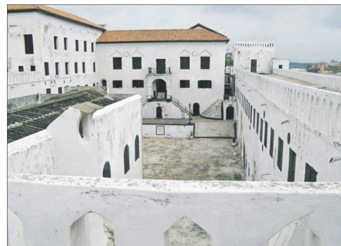
Het slavenfort Elmina in Ghana.

om het verbod op handel met de Spanje te ontduiken. De firma Anselmo liet niet alleen schepen varen maar bezat ook allerlei verre handelsposten inclusief eigen vertegenwoordiger voor de slavenhandel in Brazilië.