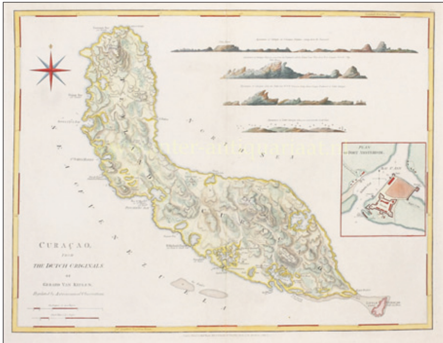
Plattegrond van Curaçao; 1775, Robert Sayer.

Het boek 'Haarlemmers en de slavernij' is veel meer dan een beschrijving van hoe Haarlemmers betrokken waren bij de slavernij. Zo worden door de auteurs Dieneke Stam en Ineke Mok in ruim veertig van de tweehonderdtachtig bladzijden die dit boek kent Curaçao en zijn rol in de slavernij uitvoerig op allerlei gebieden en fronten besproken.