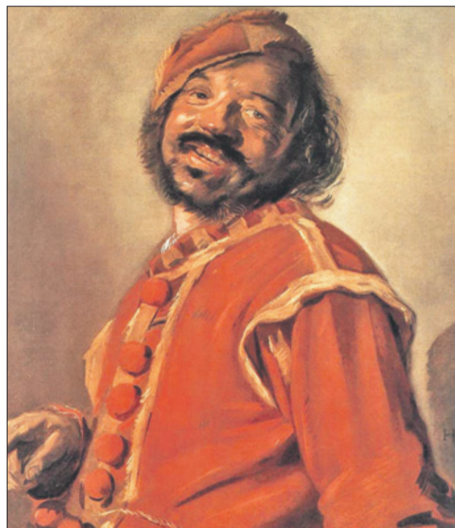
Dit schilderij van Frans Hals uit 1628 kreeg in 1889 plots een nieuwe naam.

Het boek 'Haarlemmers en de slavernij' is veel meer dan een beschrijving van hoe Haarlemmers betrokken waren bij de slavernij. Zo wordt door de auteurs Dieneke Stam en Ineke Mok uitvoerig stil gestaan bij het racisme dat ten grondslag ligt aan de slavernij en dat een rode draad is in dit eeuw voor eeuw opgebouwde onderzoek en waarover in de inleiding al gesteld is dat dit niet verdwenen is met de afschaffing van de slavernij.