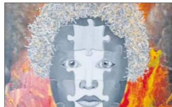
Afbeelding op de cover van 'Contrasten in kleur'.