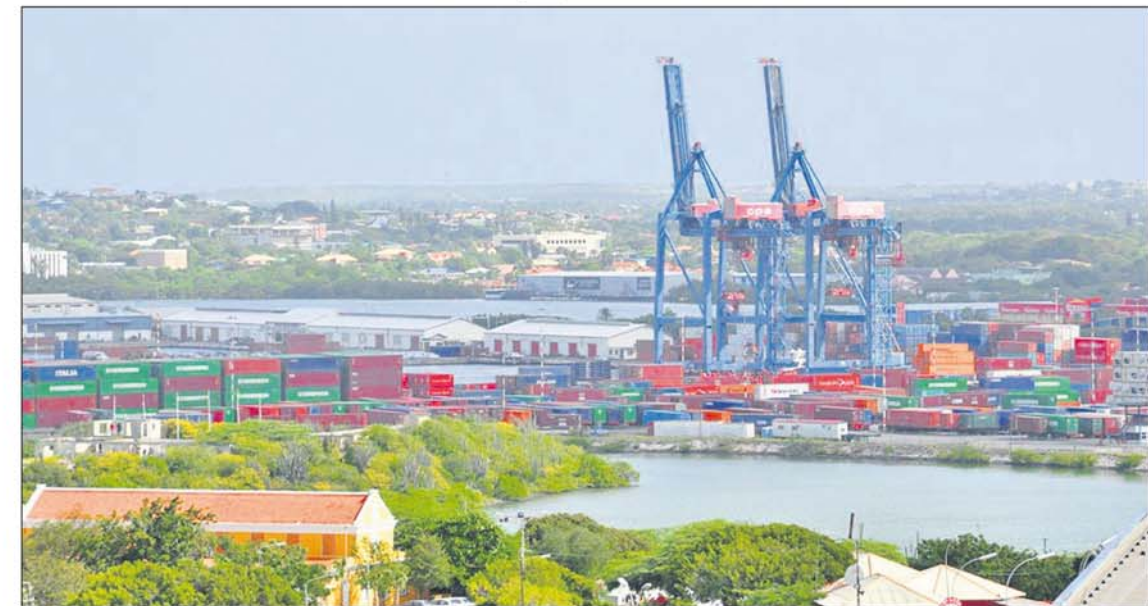
Curaçao is de belangrijkste doorvoerhaven in het Caribisch gebied tussen Europa en Zuid-Amerika en tussen Noord-Amerika en Latijns-Amerika.

Joseph Hart loopt met zijn enthousiasme fel van stapel