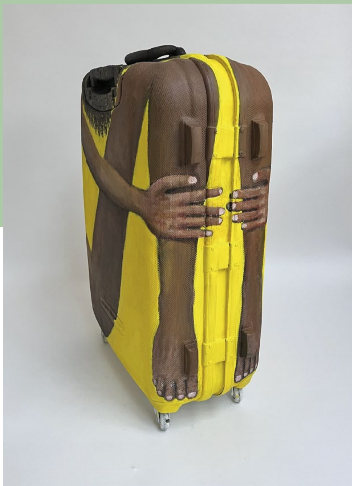
Larissa Neslo - Koffergirl